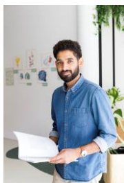
Zoom sur LE FORMATEUR

« Convaincu de la nécessité de remettre l'utilisateur au centre de la démarche de conception, j'adopte une approche humaine et empathique centrée sur les usages en considérant toujours l'humain comme un expert de son quotidien. J'ai à cœur de développer des projets qui ont du sens pour répondre aux enjeux sociétaux d'aujourd'hui et de demain. »