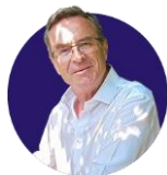
Zoom sur LE FORMATEUR

Pour tous les faiseurs de l'inclusion : animer des médiations alternatives et régénératives par le maraîchage