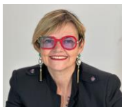
Zoom sur LA FORMATRICE